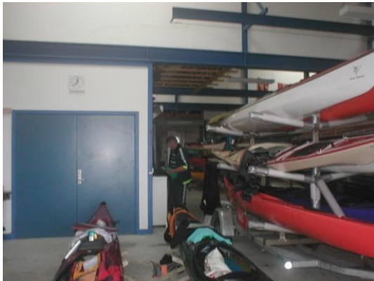
Assens Roklub kl. 12.23

Turen fortsatte herfra stik nord de næste 9 km og herefter næsten ret vest de næste ca. 6 km, og med den værende vind, betød det så igen mod- til sidevind.