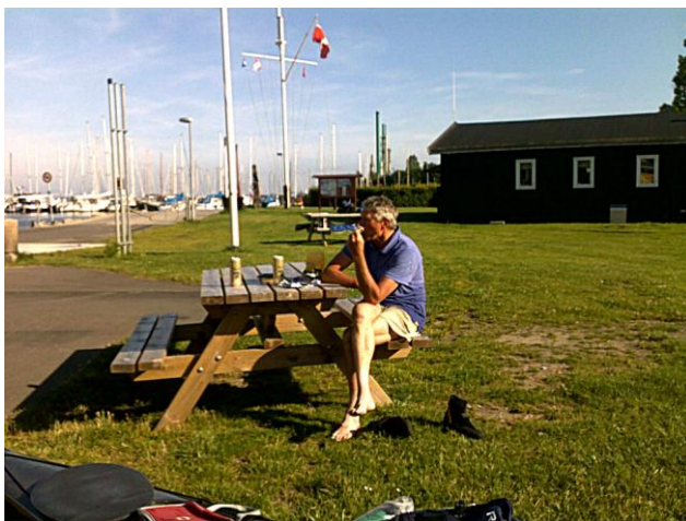
Nyborg Roklub kl. 18.16.

Jeg havde i mellemtiden fundet 2 store elefanter og noget rugbrød og rullepølse frem, og det gjorde godt.