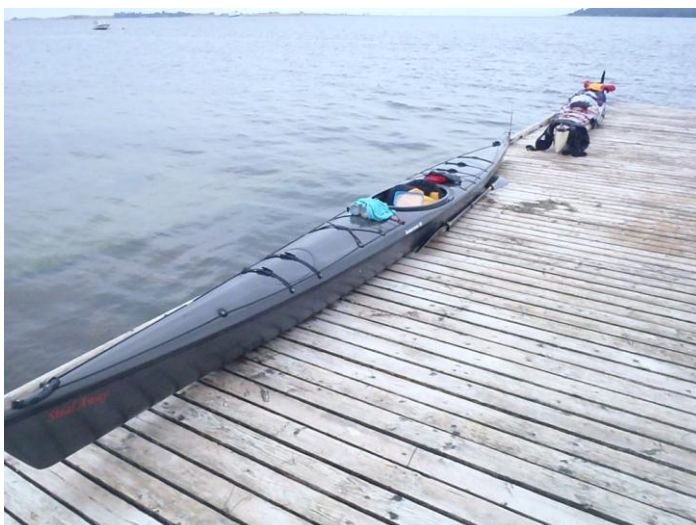
Ankommet til Fåborg kl. 11.45 - her roligt vand

Fåborg efter 29 km's roning. Mig med meget, meget ømme knæhase!! - fordi - skulle det vise sig - jeg om søndagen fra Nyborg af hensyn til en evt. kraftig medsø havde sat pedalerne et hak tættere på, end jeg ellers plejer at ro med for at have bedre hold i kajakken - og hvad er det så ellers lige, at man plejer at belære nye roere om mht. siddestilling !!