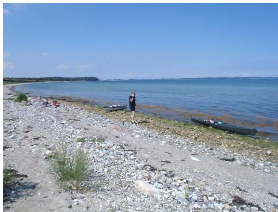
Flaskeopfyldningspause m.v. ret før Klinten i Kerteminde Bugt kl. 13.38 - 14.10

Som vi kom ned ad kysten, måtte vi konstatere, at vi havde mere og mere modstrøm, og på et tidspunkt lå vi under 6 km i timen. Glædeligt kunne vi dog også konstatere, at vinden åbenbart ikke ville tiltage som varslet, men at den holdt sig tilpas i ro, så der kun var moderate krusninger på vandet.