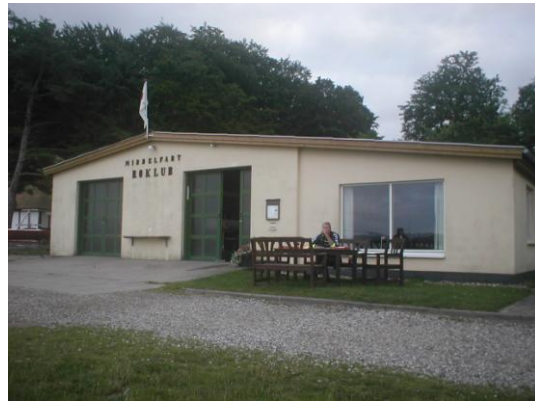
Pizzatime - akkompagneret af legende marsvin ret ud for klubbens anløbsbro

Denne gang en god varm pizza efter eget design, da vi ikke havde noget menukort.