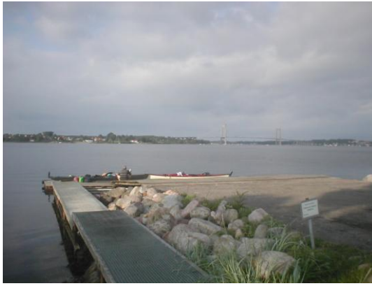
Middelfart roklub kl. 18.57