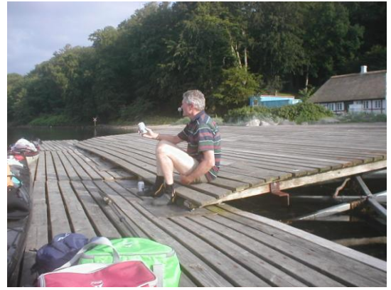
- elefantid ----- a beer - ohh what a beer!.

Denne gang en god varm pizza efter eget design, da vi ikke havde noget menukort.