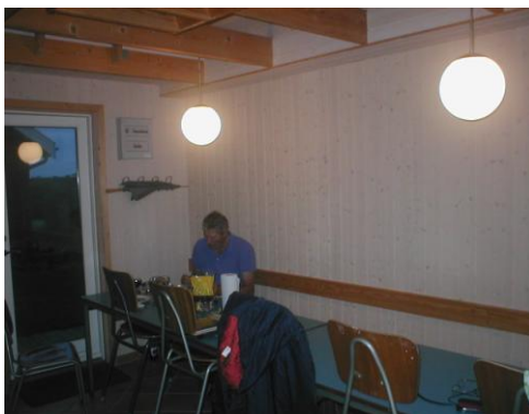
Aftensmad kl. 21.38

De obligatoriske dåsebøf, rugbrød og rødvin.