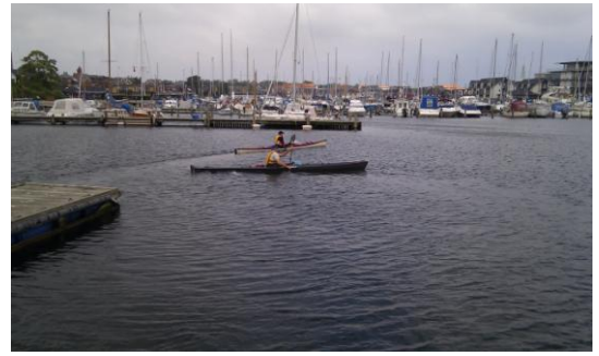
og kl. 14.25

Det var ikke just fladt vand, der mødte os, men dog heller ikke værre søer agten ind fra bagbord, end at det var til at have med at gøre. Medsø kan være udmærket, men kan dog også være rimeligt trættende at ro i, hvis man ikke tilpasser sin roning, og det kan være lidt vanskeligt, når man lige er startet og gerne vil ”der-ud-ad” - og en selv kunne jo selvfølgelig heller ikke nære sig for at skulle surfe lidt indimellem.