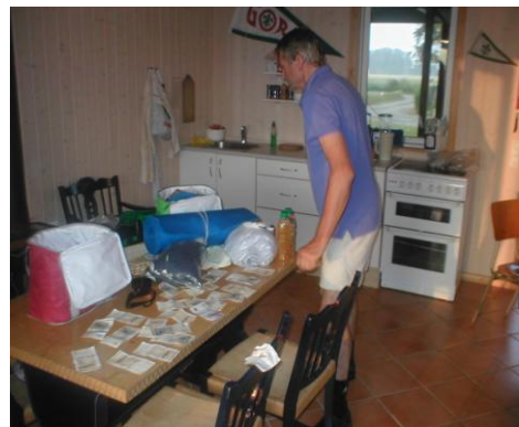
Tørring af penge!!

Det var blevet noget sent, så vi valgte først at stå op til vanlig tid kl. 04.30 - dvs. 4. dag med mulighed for maximalt 5 - 5 ½ times nattesøvn.