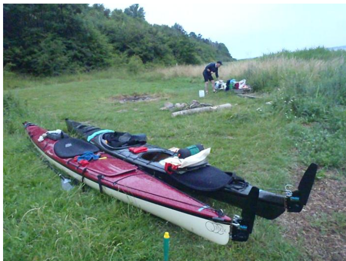
kl. 05.32 - næsten klar til afgang allerede?

Igen vækning kl. 04.30 og først afgang ca. kl. 06.15 - men her skulle vi jo også pakke telt sammen.