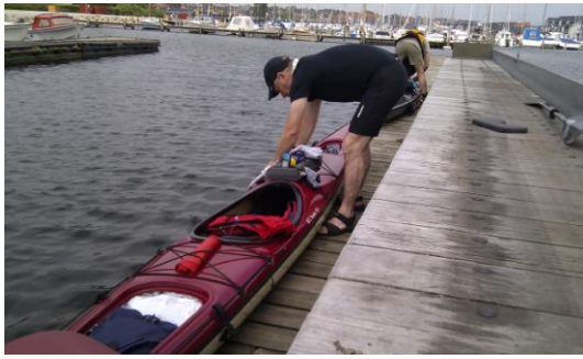
Nyborg havn søndag d. 3. juli kl. 14.10