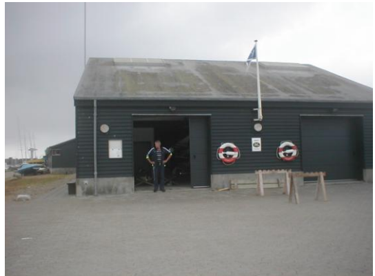
og kl. 12.24

Det viste sig dog, da vi kl. 13.05 kom af sted, at vinden var drejet lidt mere i vest mod sydvest og taget af, så det gik rimeligt, og under krydsning af Tybrind Vig, gik der pludselig ræs i den, endog så meget, at Ove på gps'eren målte max.hastigheden til 12.6 km/t !