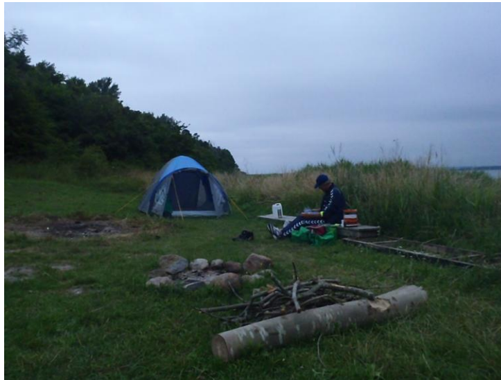
Kl. 20.45 rugbrød med røget laks og røget filet, dertil rødvin.